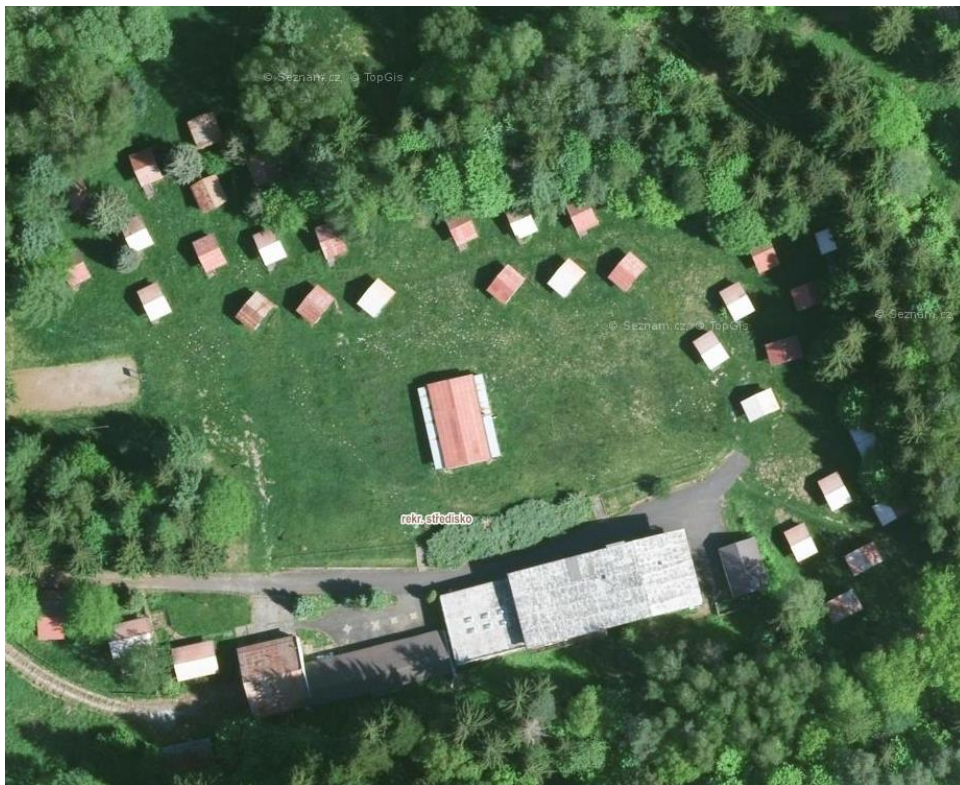
Obrázek 3: rekreační areál v blízkosti koupaliště, Jetřichovice

Rozvolněná struktura drobná odpovídá měřítkově drobné zástavbě, zejména rekreačních chat v kempech a rekreačních areálech, kde jsou jednotlivé stavby volně rozmístěny a nezohledňují vazbu na okolní zástavbu ani na veřejné prostranství