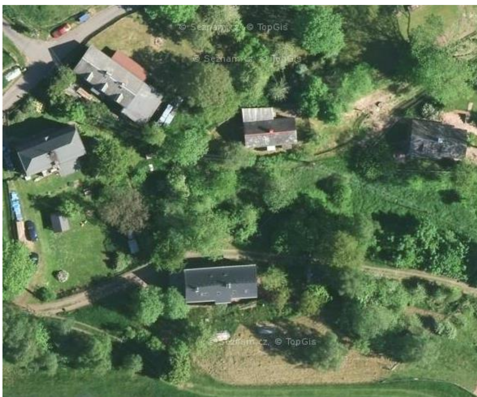
Obrázek 2: zástavba v jižní části sídla Vysoká Lipa

Rozptýlená struktura nezarovnaná odpovídá zástavbě samostatných objektů, které jsou rozmístěny volně v sídle či krajinně bez čitelné prostorové vazby na veřejné prostranství komunikace.