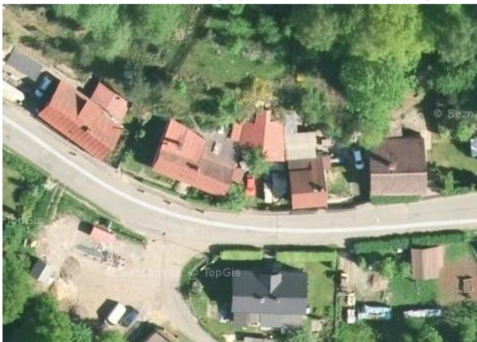
Obrázek 1: Zástavba u silnice III. třídy, Jetřichovice

Rozptýlená struktura zarovnaná odpovídá zástavbě samostatných objektů, které jsou umístěny zpravidla na soukromých oplocených pozemcích podél veřejného prostranství komunikace a přispívají tak k vymezení uličního prostoru, uliční hranu tvoří buď vlastní objekty nebo oplocení pozemků těchto objektů.